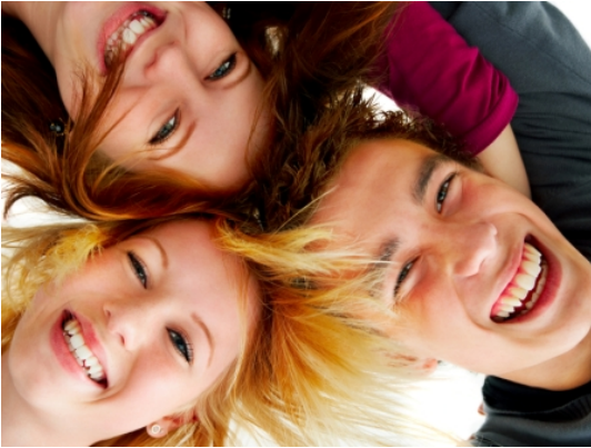
Program prevencije napada na mlade